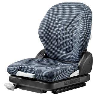
PRIMO® M für kleine Gabelstapler

Mit seiner niedrig aufbauenden mechanischen Federung mit 80 mm Federweg ist der PRIMO® XM insbesondere für kleine Fahrer cabins konzipiert. Dabei ermöglicht das komfortable Sitzoberteil mit 470 mm Sitzpolsterbreite und mechanischer Lordosenstütze jederzeit ein sicheres und ergonomisches Sitzen. Das Gewicht der Fahrer:innen wird bei diesem Modell schnell und einfach mit einer leicht zugänglichen Ratschenfunktion eingestellt. Standardmäßig verfügt der PRIMO® XM über ein duosensitives ELR-Gurtsystem und einen Sitzkontaktschalter.