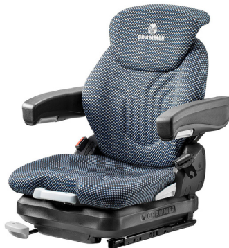
PRIMO® XM für kleine Gabelstapler und kompakte Baumaschinen

Ergonomische Sitzpolsterung, verlängerte Rückenlehne, Lordosenstütze, 80 mm Federweg – der PRIMO® XXM vereint Kompaktheit mit viel Komfort und gutem Support für die Wirbelsäule. Der Sitz verfügt über einen leichtgängigen Einstellhebel, mit dem Fahrer:innen das Gewicht ganz einfach in einem Bereich von 45 bis 170 kg einstellen können. Ein klarer Vorteil bei häufigem Fahrerwechsel, denn so können auch ungeübte Nutzer:innen schnell und intuitiv das Federungsverhalten des Sitzes optimal justieren. Standardmäßig verfügt der Primo XXM über ein duosensitives ELR-Gurtsystem und einen Sitzkontaktschalter.