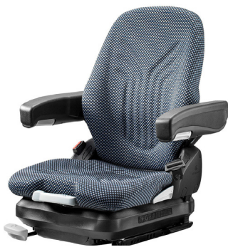
PRIMO® XXM für Schubmaststapler und kompakte Baumaschinen

Unsere Standardsitze mit mechanischer Federung.